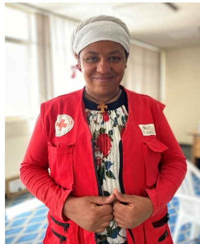
Mesoret er frivillig i Etiopisk Røde Kors og tager imod hjemvendte migranter i lufthavnen.